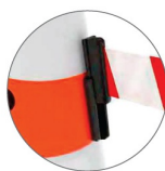
ADAPTABLE A TODA LA LÍNEA CONOFLEX

Cinta perimetral Personalizado, compuesto por un juego de Accesorios plásticos (Macho/Hembra), elementos de fijación y cinta perimetral de 4 cm de ancho x 2 mt de largo. Colores de cinta o aplicación de logo o leyenda a elección. Adaptable a toda nuestra línea de conos y columnas CONOFLEX. Mínimo de compra: 10 Kits.