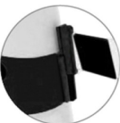
ADAPTABLE A TODA LA LÍNEA CONOFLEX