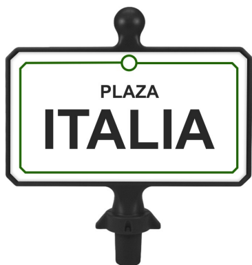
GRÁFICA SOBRE VINILO